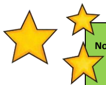
TABLEAU DE CORRESPONDANCE ENTRE LE NOMBRE D’ERREURS ET L’ÉCHELLE D’APPRÉCIATION POUR LA CORRECTION DE L’ORTHOGRAPHE